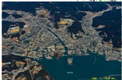
南三陸町 志津川周辺の被災状況