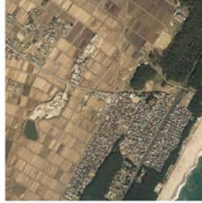
被災前（平成18年10月撮影）