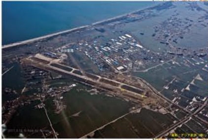
仙台空港周辺の被害状況