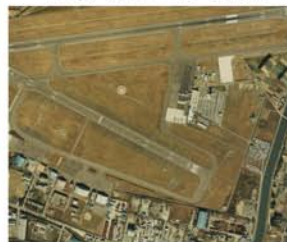
被災前（昭和59年11月撮影）