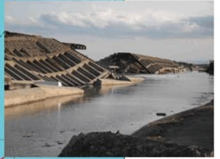
岩沼市二の倉海岸の被害状況