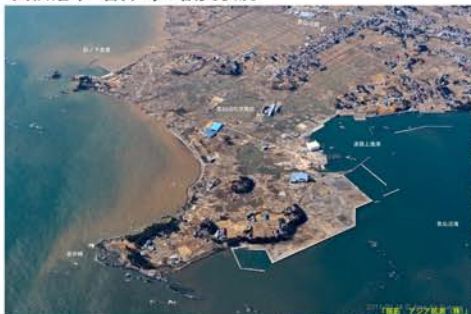
気仙沼市 岩井崎の被災状況