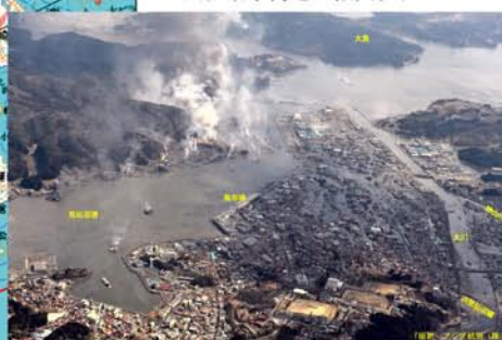
気仙沼市街地の被災状況